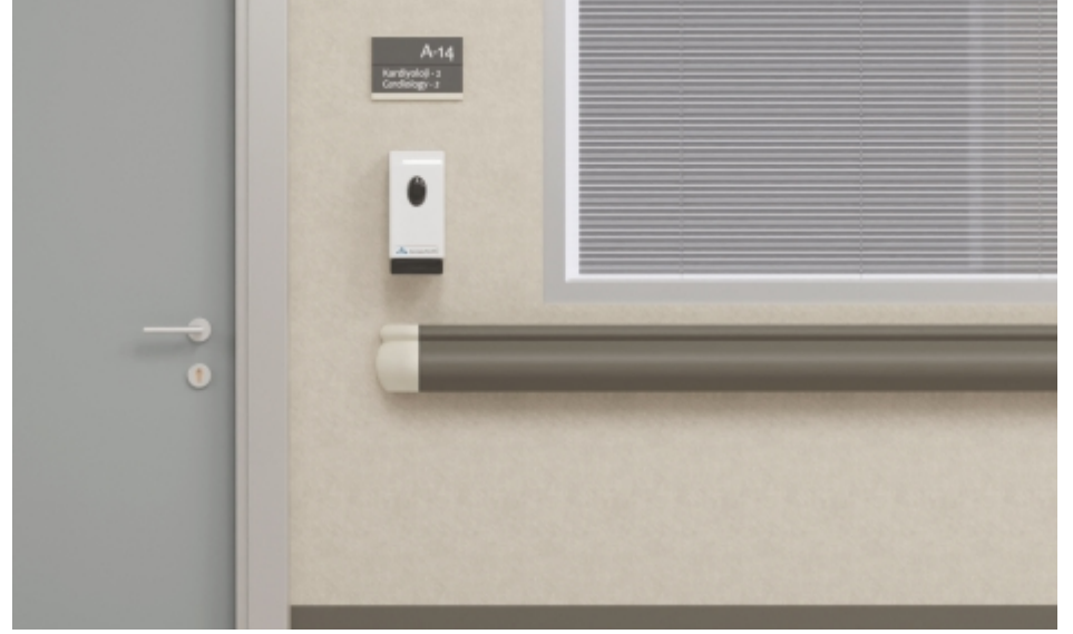
Koridorlar ve Bekleme Alanları Hallways and Waiting Areas