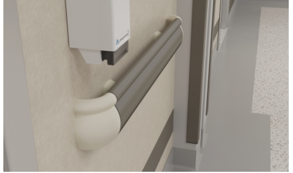
Duvar Yüzeyleri Wall Surfaces