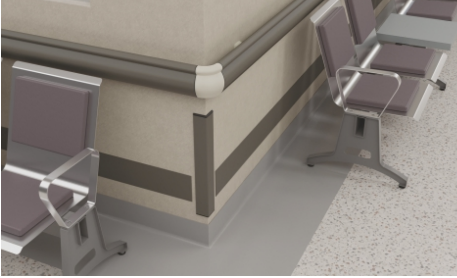
Duvar Köşeleri Wall Corners