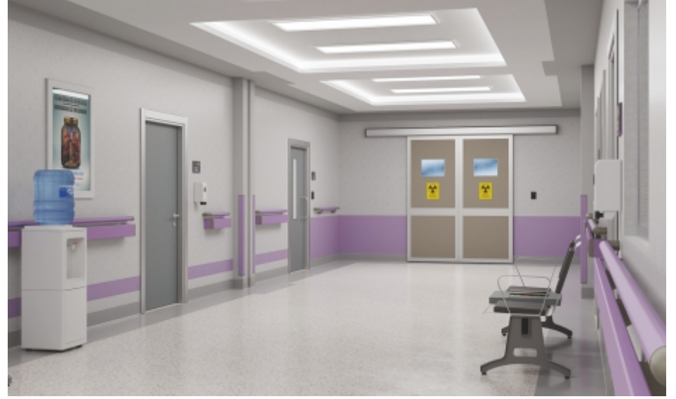
Koridorlar ve Bekleme Alanları Hallways and Waiting Areas