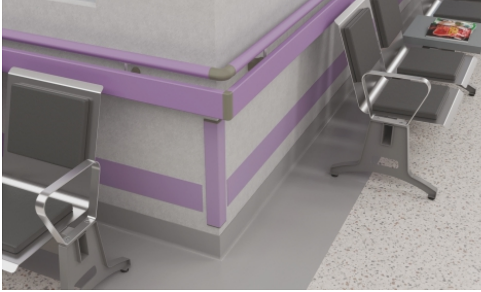
Duvar Köşeleri Wall Corners