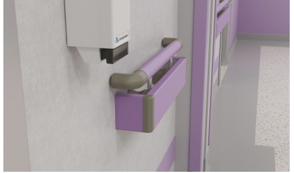
Duvar Yüzeyleri Wall Surfaces