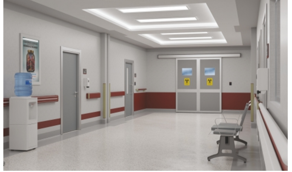
Koridorlar ve Bekleme Alanları Hallways and Waiting Areas