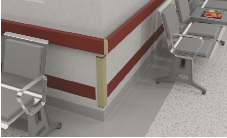
Duvar Köşeleri Wall Corners