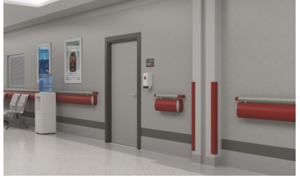
Koridorlar ve Bekleme Alanları Hallways and Waiting Areas