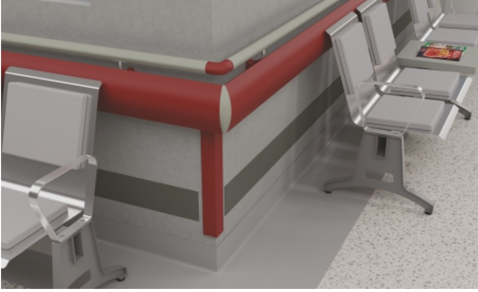
Duvar Köşeleri Wall Corners