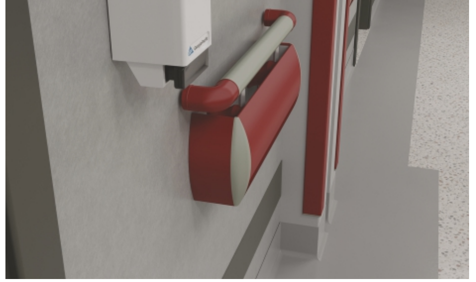
Duvar Yüzeyleri Wall Surfaces